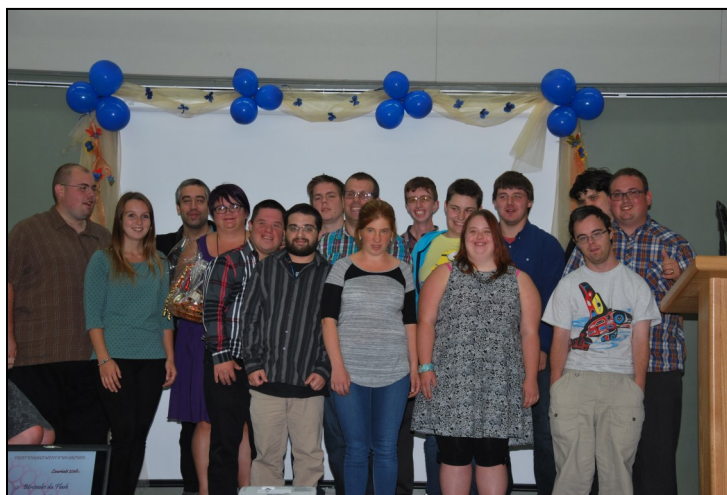
Sur la photo: Les bénévoles du Flash de l'Amalgame

D'ailleurs, l'ARLPH est fière de l'un de ses membres qui a reçu le prix coup de cœur par le Jury! Les bénévoles du Flash de l'Amalgame MDJ Ouest ont reçu ce titre et c'est avec enthousiasme qu'on les félicite. Vous pouvez lire l'article au complet paru dans le « Journal de Lévis » au http://www.journaldelevis.com/1298/16209/Un_15e_hommage_aux_benevoles_en_sport_et_loisir.journaldelevis