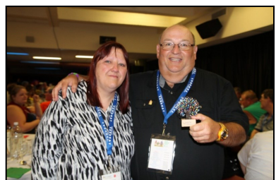
Un des gagnants prix coup de coeur

Pour la première fois, dans la grande région de la Chaudière-Appalaches et plus précisément dans la Ville de Saint-Georges s'est tenu Destination Loisirs 2016 . Cet événement d'envergure s'est déroulé du 2 au 5 septembre dernier . Cette 15 e édition a été organisée par l'Association régionale de loisir pour personnes handicapées de la Chaudière-Appalaches (ARLPH-CA). Ce rassemblement provincial se déroule aux deux ans et permet de découvrir la région hôte par des loisirs touristiques, culturels et sportifs. Cette année, Destination Loisirs avait le thème de l'inclusion sociale. Les activités qui entouraient cet événement permettaient de briser l'isolement et de faire de nouvelles connaissances pour les personnes ayant des limitations! 540 personnes âgées de 18 ans et plus y ont participé! Il y avait 13 délégations réparties dans différentes régions du Québec, dont la délégation de la Chaudière-Appalaches!