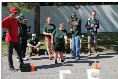
Les participants ont du plaisir!