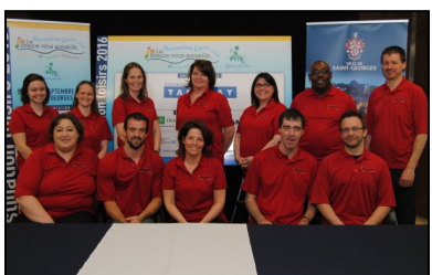
Comité organisateur de DL 2016